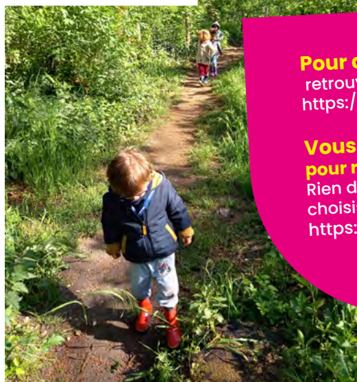
Sur le chemin

Nous leur offrons un nouveau terrain de jeu, qui constitue un équilibre entre un lieu fixe qui est connu et rassurant, et un lieu