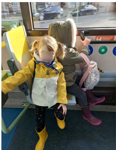
Dans le bus

A partir de mars et jusqu'à la fin de l'année, nous nous rendons chaque vendredi avec la classe de nos 26 élèves de petite section en classe dehors. C'est l'occasion de permettre aux élèves de faire l'expérience d'un espace nouveau qu'ils vont pouvoir s'approprier au fil du temps qui passe.