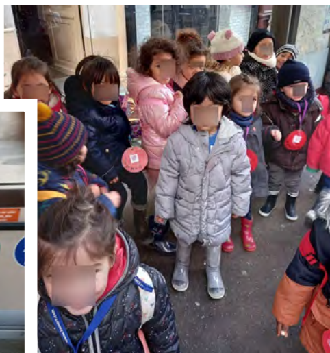
En attendant le bus